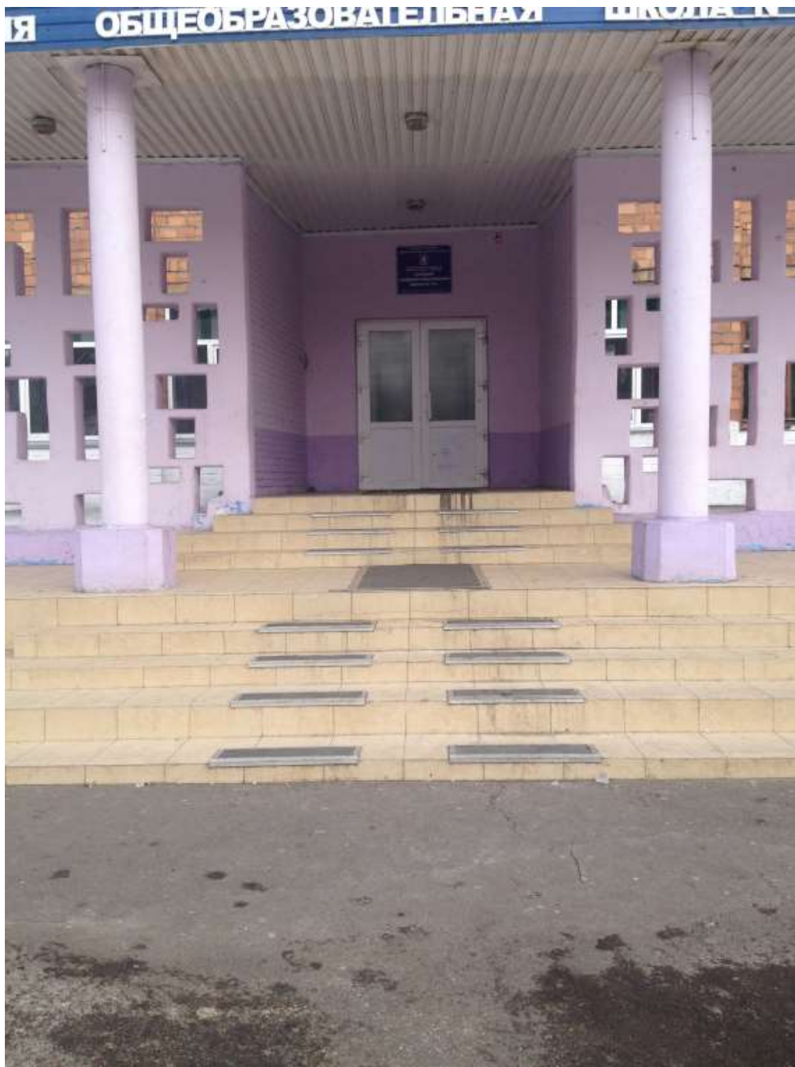
Вход в здание Фото 3